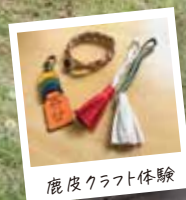
鹿皮クラフト体験